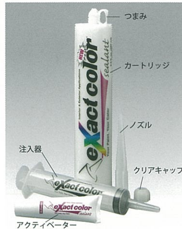
アクティベーター